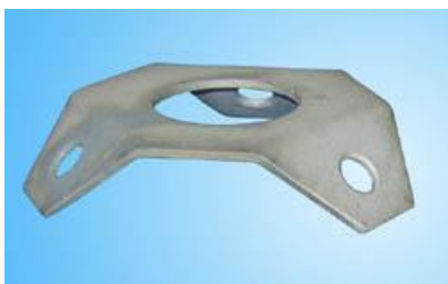
Кольцо под оттяжки

Мачты MF-3, MF-6, MF-9 могут применяться в качестве промежуточных для выноса антенн от основной мачты или ферменной конструкции. Рекомендуются для размещения базовых дипольных и направленных антенн. Также данные изделия могут использоваться в качестве основных мачт (МА-3, МА-6, МА-9), если их доукомплектовать необходимыми аксессуарами: подпятниками, кольцами под оттяжки (входят в комплект поставки) талрепами, оттяжками и др.