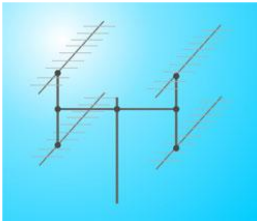
Схема стэка 4Y21-70cm HOR - E2xH2 (27.5Kb)

107497, г. Москва Черницынский пр-д. д.7 стр 1. Тел.: (495) 775-43-19 (многоканальный) Тел./Факс 462-44-14, 462-41-75 E-mail: radial@radial.ru www.radial.ru